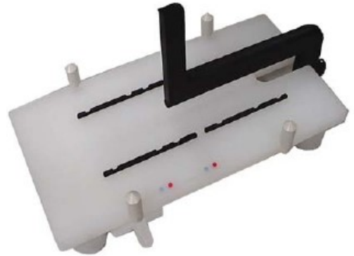
WT - 手動ウエハ移載機